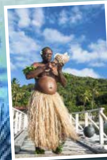
We genieten van een traditioneel ontvangst op het eilandje Makogai.

MOUNT MUTINY De bodem bevindt zich bij deze muurduik op meer dan 1000 meter diepte. Toch is het rijke pelagische leven hier niet het belangrijkste lokkertje, maar wel de regenboogmuur. Lange slierten zacht koraal flankeren overvloedig de wand als gordijnen van een theater. Ze hebben alle kleuren van de regenboog en beslaan een afstand van 200 meter.