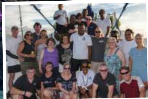
Vinaka Fiji en tot de volgende keer!

Sommige zweepkorallen worden bewoond door meerdere visjes en garnalen.