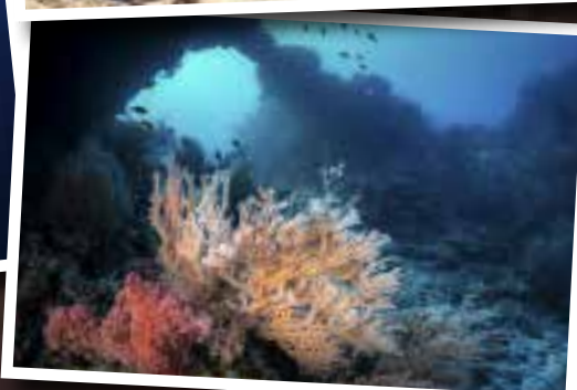
The Great White Wall is bedekt met sneeuwwit zacht koraal.