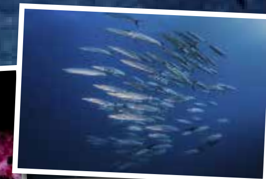
Nog meer jagers: barracuda's.

De Nigali Passage is een droom voor elke haaienliefhebber