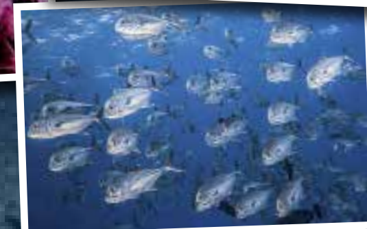
Bij Central Station komen gigantische scholen grootoog- en blauwvinmakrelen samen.